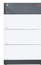
BYD B-BOX PREMIUM HVM 8,3kWh