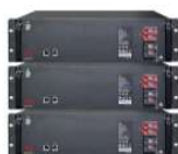
BYD B-BOX LV FLEX 5kWh