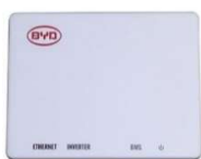
BATTERY BOX PREMIUM LV BMU