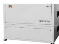
BYD B-BOX PREMIUM LVL 15,4kWh