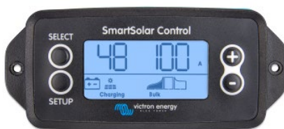
Pantalla enchufable SmartSolar

Simplemente retire el protector de goma del enchufe de la parte frontal del controlador y conecte la pantalla.