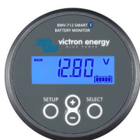
Detección de Bluetooth: BMV-712 Smart Battery Monitor