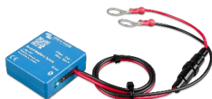
Detección de Bluetooth: Smart Battery Sense